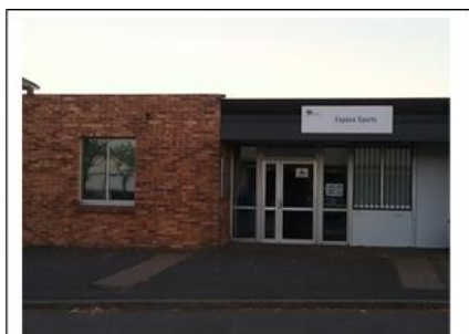
Salle polyvalente de l'Espace Sport (en face du collège) Adresse : 1 Avenue du Bois de place 91090 Lisses

*Concernant les catégories d'âges, est pris en compte l'âge de l'enfant au 1 er septembre.