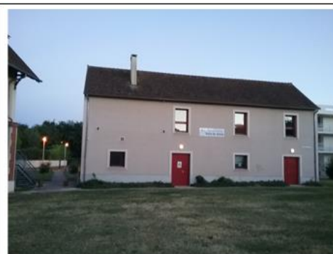
Salle de danse du Service Jeunesse Adresse : Ferme de place Avenue du château 91090 Lisses